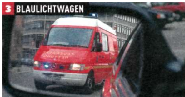
3 BLAULICHTWAGEN Blaulicht im Nacken: Um die geforderte „freie Bahn“ zu schaffen, darf selbst eine rote Ampel vorsichtig passiert werden