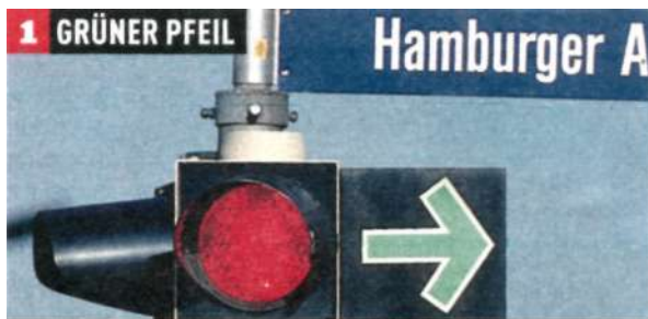
1 GRÜNER PFEIL Grüner Pfeil: Rechtsabbiegen erlaubt, doch vorher muss angehalten werden. Wichtig: Der Querverkehr hat immer Vorrang