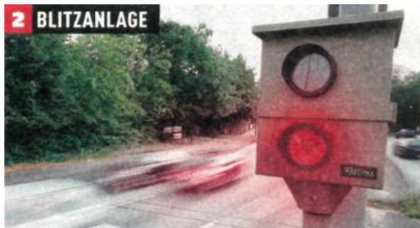
2 BLITZANLAGE Blitzer: An einer Ampel blitzt er zweimal. So wird festgestellt, ob der Wagen eine Kreuzung tatsächlich bei Rot überquert hat