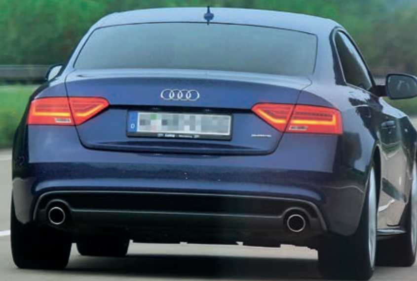
Ab durch die Mitte: Dieser Audi A5 macht sich auf der Autobahn breit; einen ersichtlichen Grund dafür gibt es nicht

Rechtsruck in Deutschland – nur nicht auf der Straße. Wir haben Mittelspur-Blockierer zur Rede gestellt